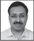
എസ്. ഹരികൃഷ്ണൻ എ.എ.എസ് ഡയറക്ടർ വ്യവസായ വാണിജ്യ ഡയറക്ടറേറ്റ്